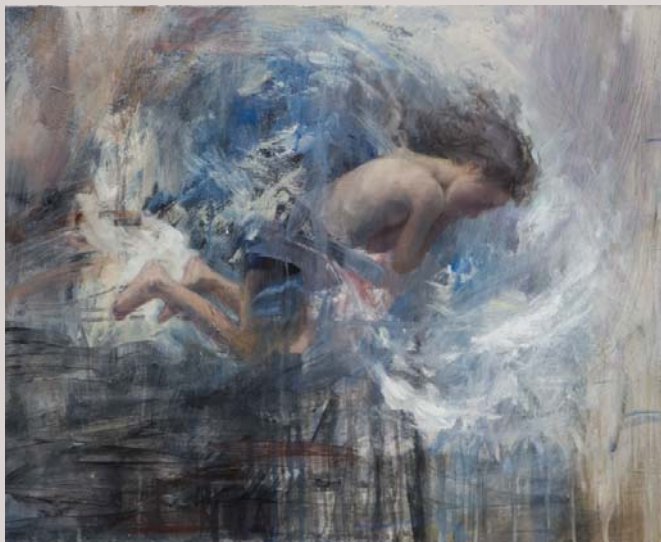
« Sueño » 2007 Huile et alkyl sur bois 60 x 50 cm.