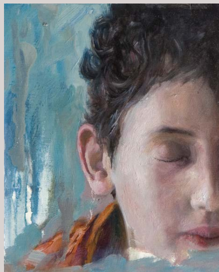
« Niño » 2007 Huile et alkyl sur bois 16 x 20 cm.