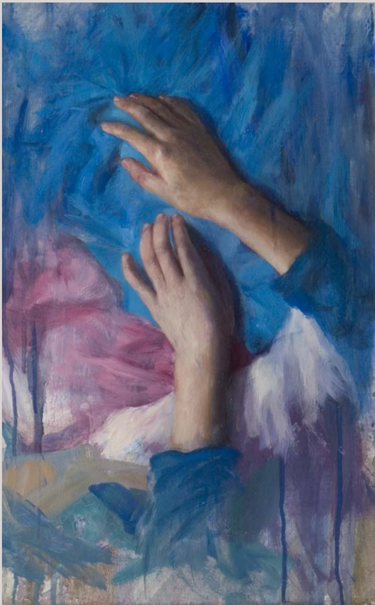
« Manos de niña » 2007