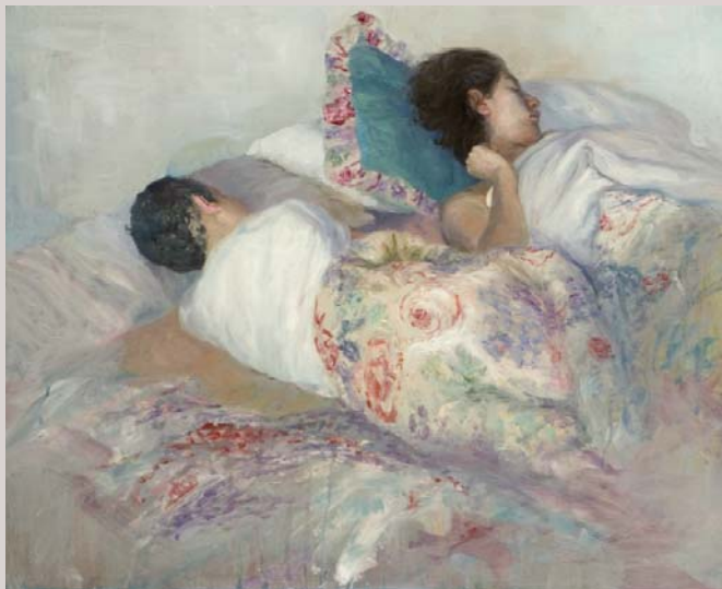
« En la cama » 2007 (Inachevé) Huile et alkyl sur bois 61 x 50 cm.