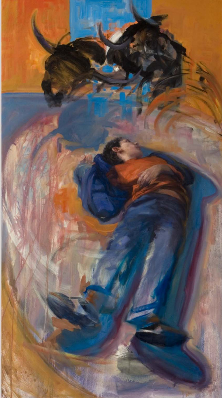
« Torero Muerto » 2007 Huile et alkyd sur toile 89 x 162 cm.