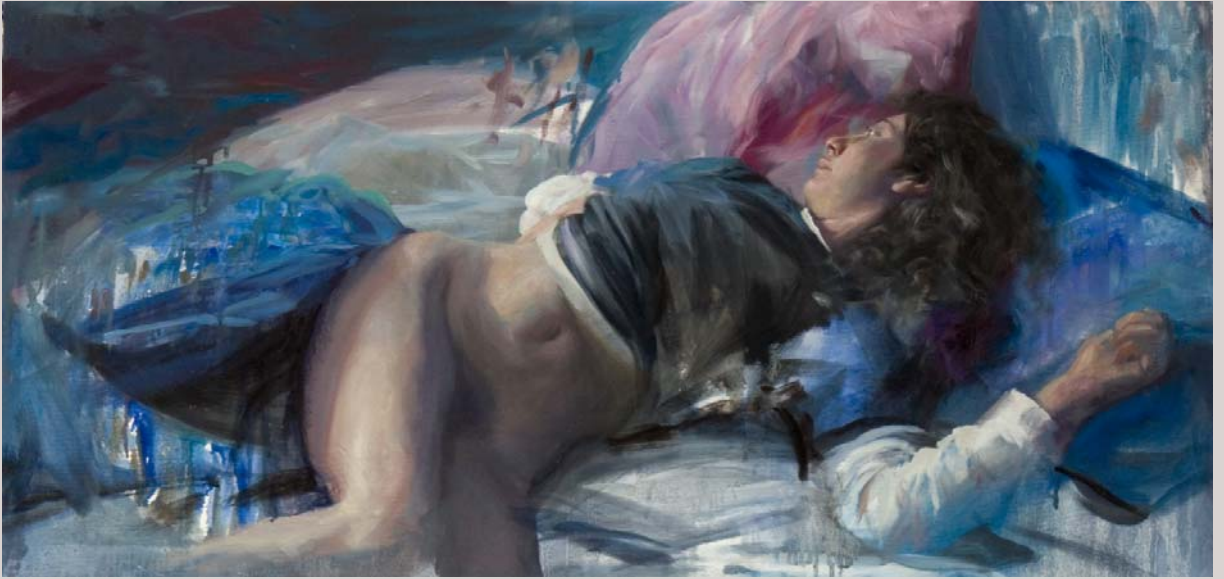
« Parito 2 » 2007 Huile et alkyd sur toile 114 x 55 cm.