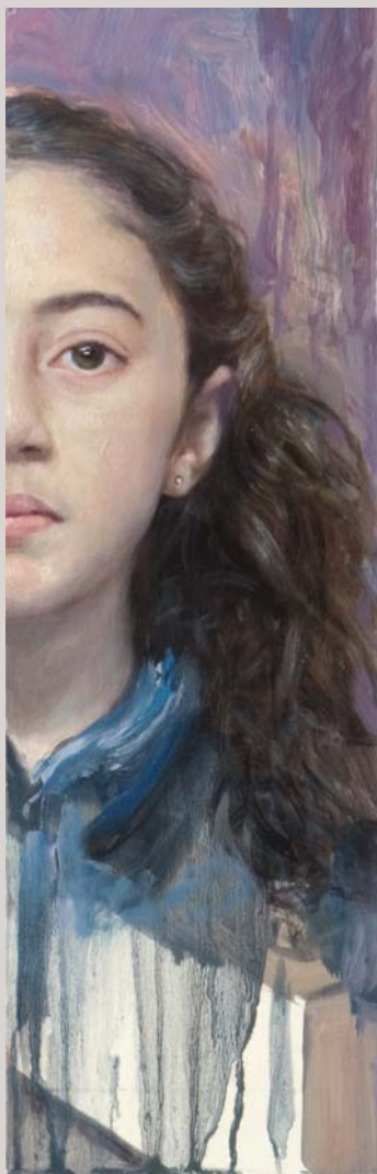
« Niña » 2007 Huile et alkyl sur bois 13 x 40 cm.