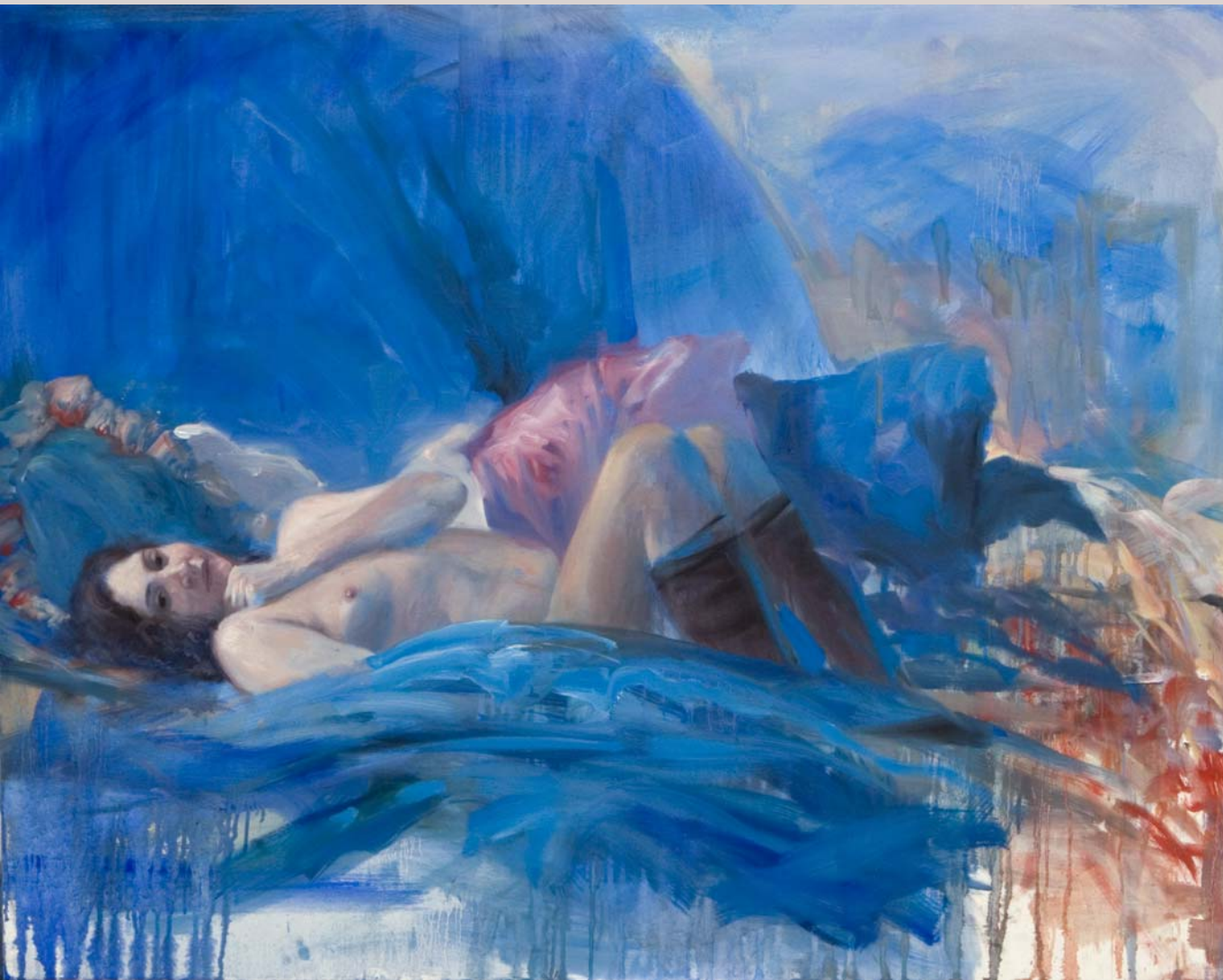
« Mujer sobre fondo Azul » 2007 Huile et alkyl sur toile 130 x 100 cm.