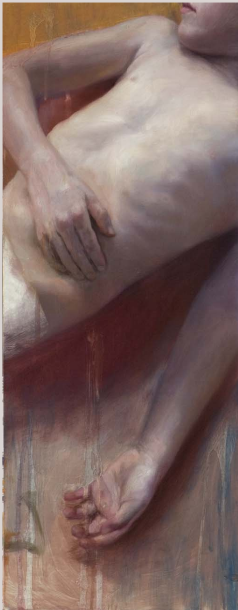
« Pecho de niña » 2007 Huile et alkyd sur bois 25 x 64 cm.