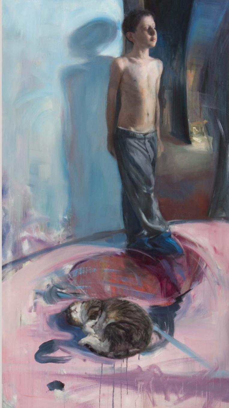
« El Toño 2 » 2007 Huile et alkyl sur toile 89 x 162 cm.