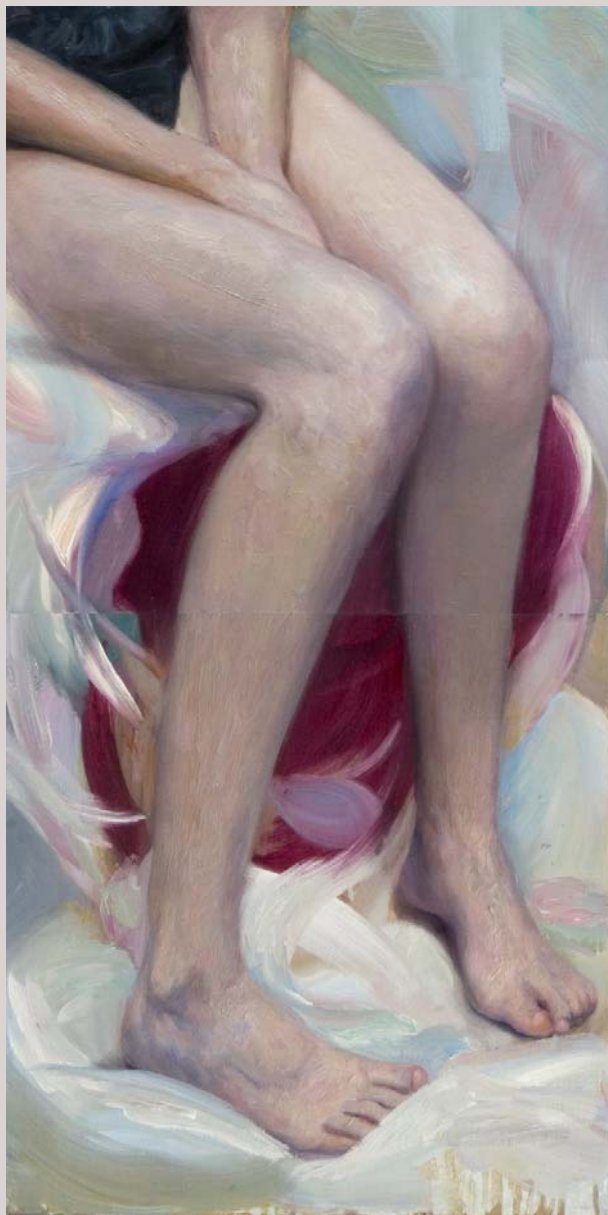
« Pequeña América 2 » 2007 Huile et alkyd sur bois 36 x 72 cm.